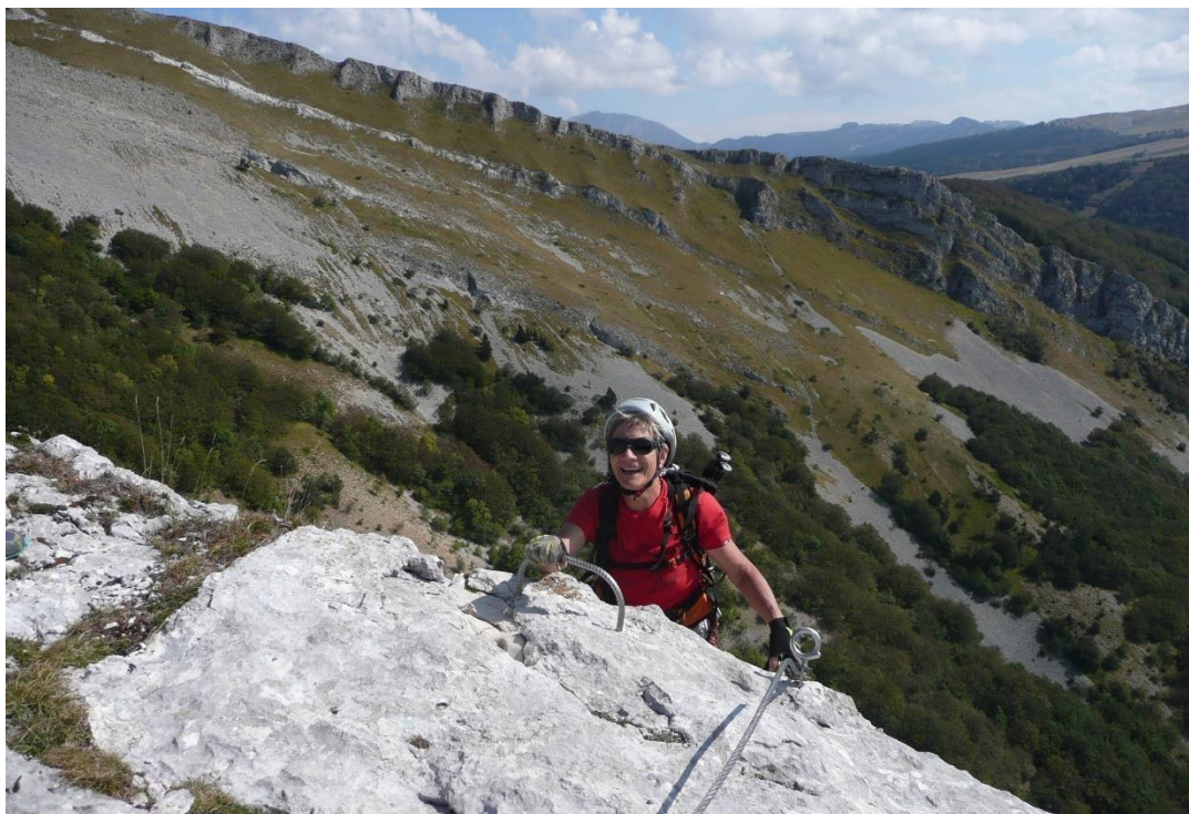
Via ferrata du col du rousset : septembre 2016